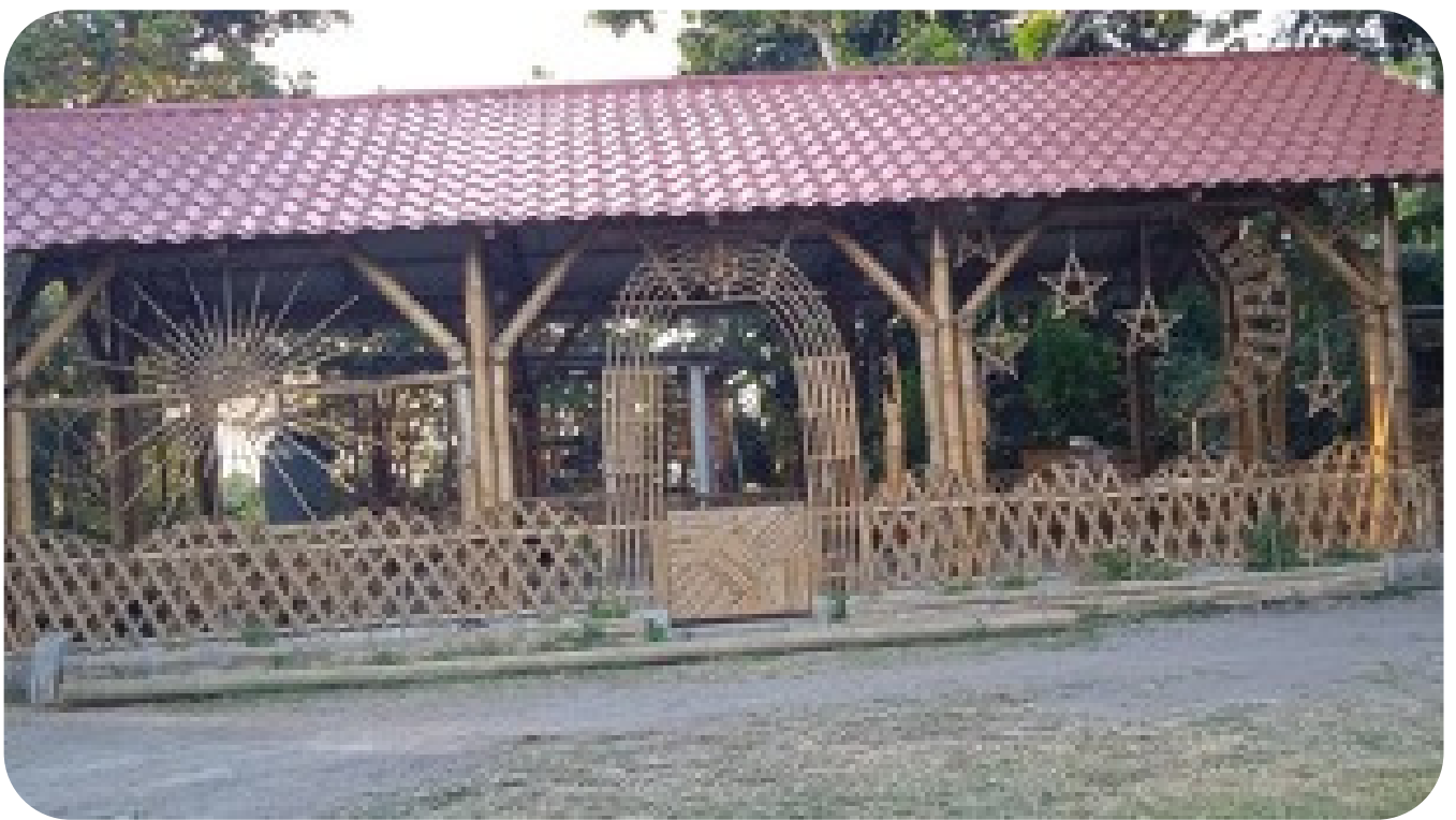
KALUTAT PAL TECHAN/ casa de bambú para pueblo

También aprendí a manejar herramienta que nunca las había utilizado, también ahora tengo un gran conocimiento y lo pongo en práctica con otros grupos de seguimiento en la EFOA en este año 2022. También conocer la importancia del bambú, sus beneficios, sus bondades tanto en medio ambiente como: barreras vivas para retención de agua, artesanías, construcción y también en la medicina. Conocí todo lo que se puede hacer con el bambú, esto no se me va a olvidar."