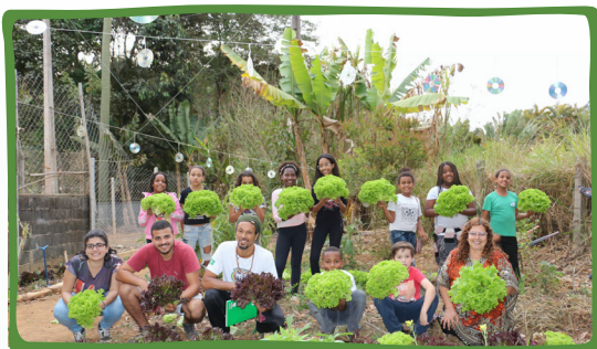
Colheita realizada com as crianças e equipe do Conviver ^

O Projeto Conviver, que teve início em 2012, integra o Programa Educação e Agroecologia da ONG Centro de Tecnologia Alternativas da Zona da Mata (CTA-ZM), com sede localizada em Viçosa (MG), e desenvolve atividades junto com crianças e adolescentes, na faixa etária de 8 a 15 anos, e com mulheres, de 45 a 80 anos.